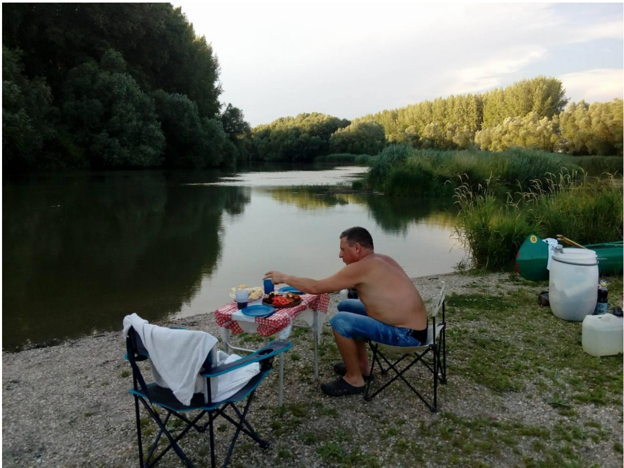
3. Kép: Első táborhelyünkön Győrlamadér szomszédságában a vacsorához készülődöm

sültekből és némi zöldségből áll. Vacsora közben látogat meg minket az utolsó kutyás, aki nem tudom, hogy mit gondol, amikor távolról csak azt láthatja, hogy egymás felé hadakozunk a levegőben. Pedig csak a szúnyogokkal vívjuk első csatánkat. Természetesen váratlan vendégünknek is beszélhetnéke van, így meg tudjuk, hogy ő inkább búvárkodik, de azért a Mosonit is végig járta. Ezen az estén már nem gyújtunk tüzet, de még sokáig gyönyörködünk a dél-keleti égbolton lapuló toronyfelhők mögül fel-fel bukkadó villámokban, majd később a távoli viharból előbújó, éppen 1 napja telt holdban. Kicsit eltöprengünk még a természet erején. Másnap tudjuk meg, hogy a Szlovákia felé elvonuló