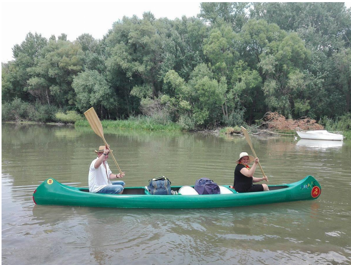
1. Kép: Búcsú Mecsénél

mi is húszas éveink közepét tapostuk. Eltávolodunk egymástól, s ők hazafelé veszik az irányt mi pedig megkezdjük életünk egyik nagy kalandját.