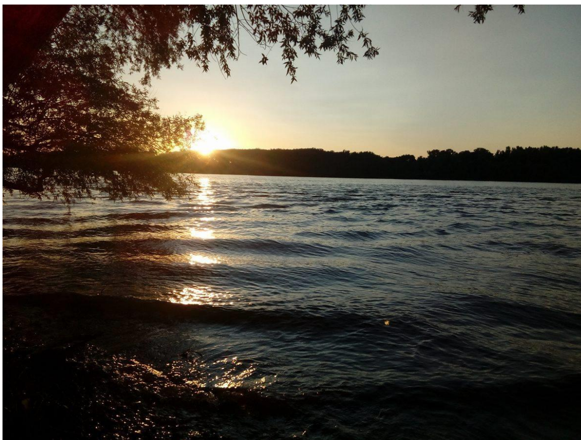
9. Kép: Naplemente dunaalmási táborunknál