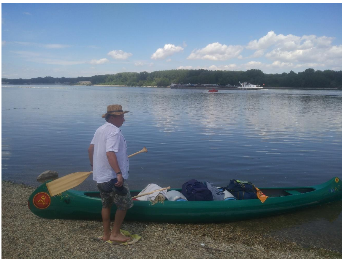
8. Kép: Hátunk mögött a gönyői pokollal

Gyorsan érünk a Gönyői kikötőbe, ahol partra húzzuk kenunkat a sóderen, hogy az út legnehezebb szakaszát magunk mögött hagyva, egy hideg Krusovicával ünnepeljük teljesítményünket. Itt középkorú holland evezősökkel találkozunk, akik kicsit hosszabb pihenőt tartanak a dunai község partján.