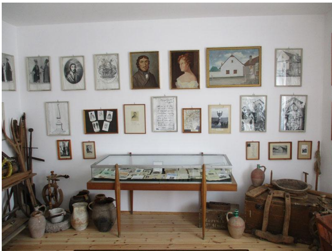
10. Kép: Csokonai - Lilla emlékszoba