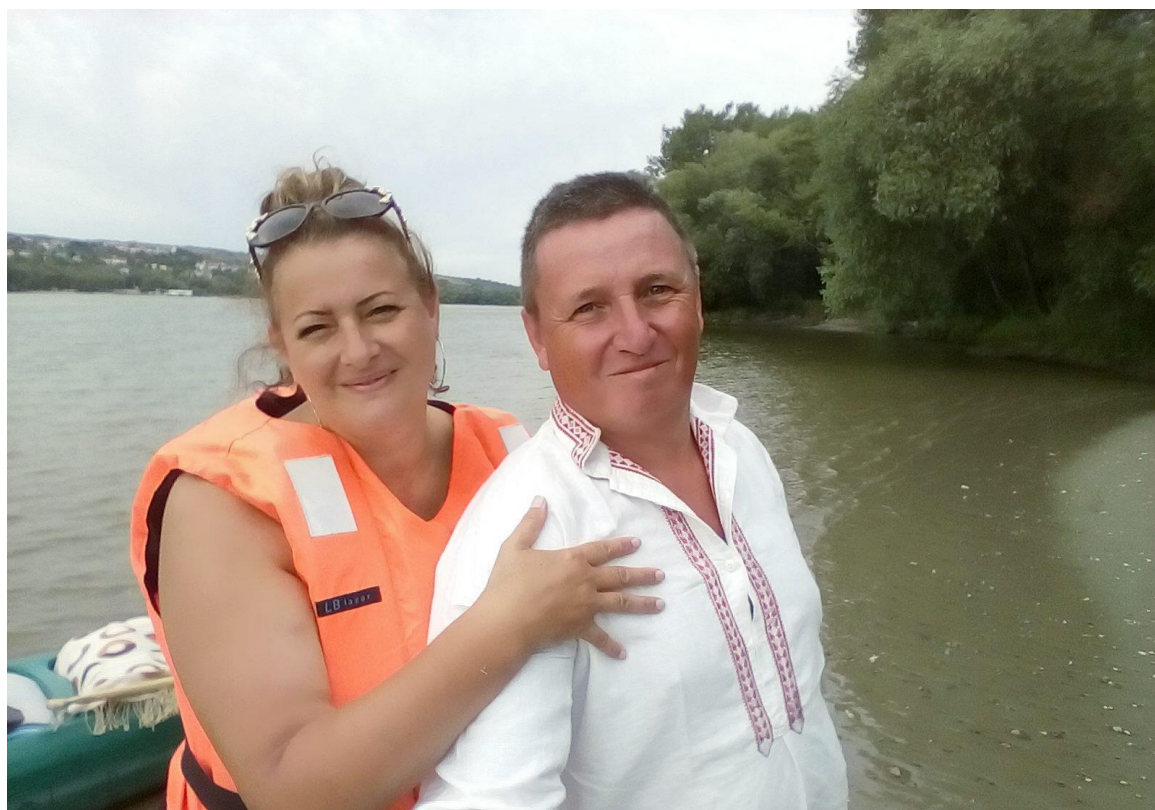
13. Kép: Pihenő Lábatlannal szemben

Süttőtől kezdve egyre több teher- és szállodahajóval találkozunk. Csilla nem szereti őket, mégis lassan megszokja a jelenlétüket. Felhős az ég, amit annyira most nem bánunk, a levegő ennek ellenére kellemesen meleg. Szlovákiai oldalon, egy sóderzátónynál állunk meg először, Karva falu alatt, Lábatlannal szemben. Az oldalról feltámadó szél kicsit