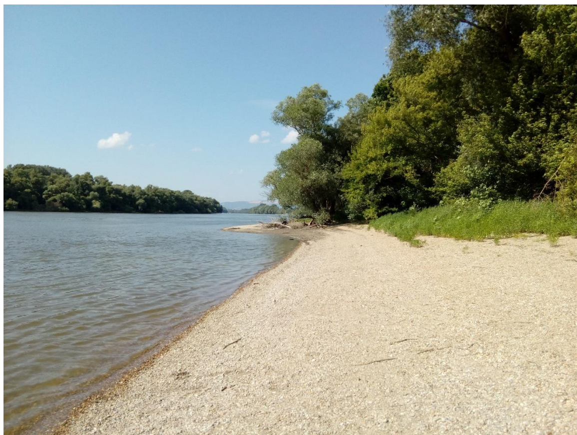
15. Kép: Kacsa-sziget