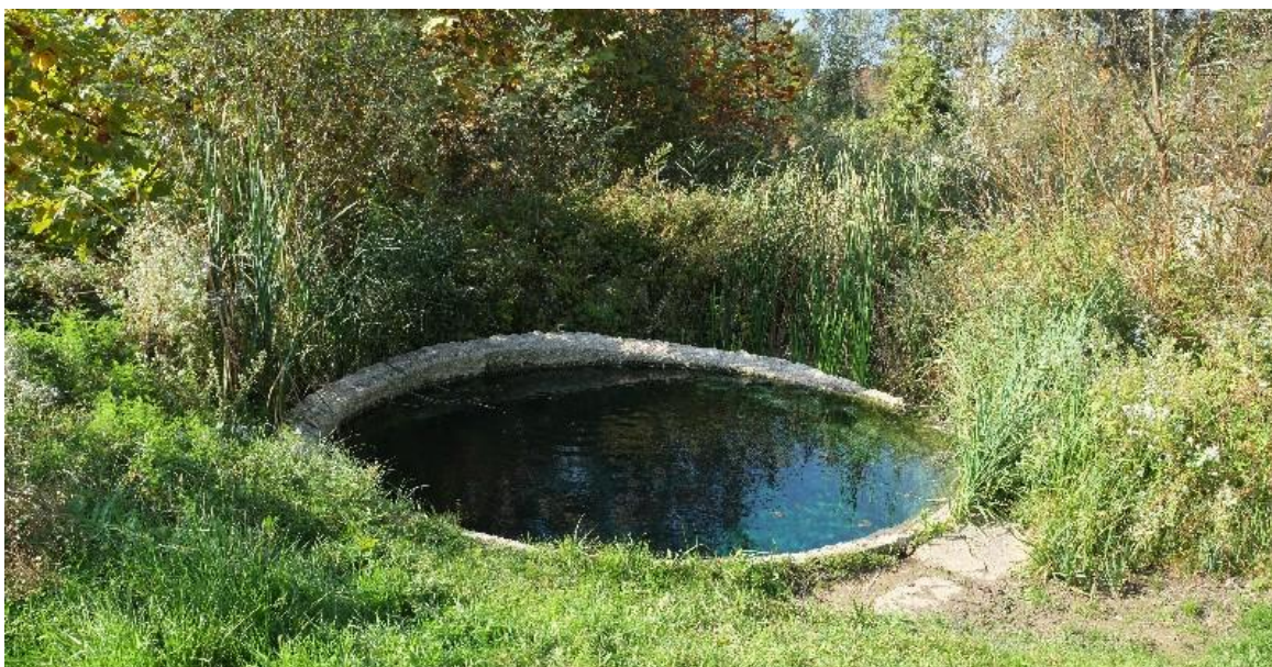
11. Kép: Hévíz forrás a volt strand mellett

A hajóállomástól északi irányba indulunk el, és a középkori öreg malom romjai után, a vasútállomással szemben rá is lelünk a Weinenger Mátyás által 1900-as évek elején létesített Milleneumi emlékpark és fürdő területére. A strandfürdő 1914-ben nyílt meg a nagyközönség előtt. Egészen a háborúig virágzott a fürdő. Felnőtt és gyerekmedencék,