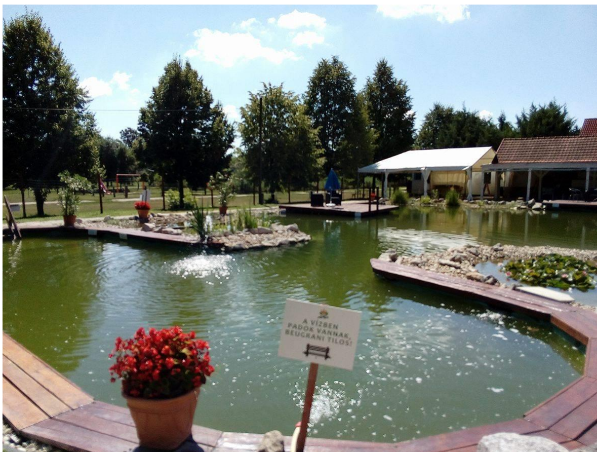
7. Kép: Az Aranykert öko tava

folytasson Facebookon, hanem fotókat mutasson nekem a két Duna összefolyásáról, és tanácsokat adjon a behajózáshoz. Kiderült, hogy anno szállodahajón szolgált, és onnan a tapasztalat. Gondoltam, hogy Budapest végighajózása mellett ez lesz túránk másik kritikus pontja, ahol már sok túrázót ért baleset. De én se nyeletlen kétévesként vágok majd neki ennek a pár kilométernek, így nincs bennem egy szemernyi félsz sem. Annak, aki viszont még nem rendelkezik elég tapasztalattal én is rutinos kormányost javaslok az átkeléshez. Vendéglátónk szerint kritikus lehet, ha a bósi öblítőcsatornán érkező hajók, nagy ívben akarnak beállni a Gönyűi átrakodóba. Délkeleti szélben például egyáltalán nem tudják koordinálni a hosszú vontatmányokat, így azok kiszámíthatatlan veszéllyel vannak a túrázókra. Én hasonlóan életveszélyesnek tartom, ha folyásiránnyal ellenkező irányból érkező szél fúj, mert tengeri hullámokká korbácsolja az amúgy sem sima vízfelületet. Bevallom ez is szerepet játszott abban, hogy nem tegnap hajtottuk végre ezt a manővert. Közben kiderül, hogy nagyobb fiamék is pont ebben a táborban töltötték nyolcadikos osztálykirándulásukat. Amíg ő pár hete unalmas helyként említette – otthon felejtette az okostelefont – mi úgy éreztük, hogy a nyugalom szigetére tévedtünk, ahol még napokat