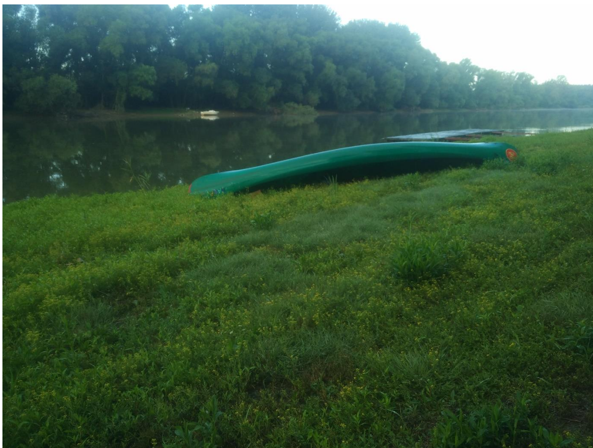
6. Kép: Happy is elpihen a véneki fővényen...