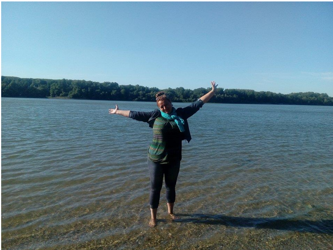
12. Kép: Szép az élet - Dunaalmás

Azt hiszem ezt még nem veszem teljesen komolyan és éjszaka azon gondolkodom, lehet, hogy tényleg pihenéssel kéne tölteni a túra második felét, ha leérünk Leányfalura.