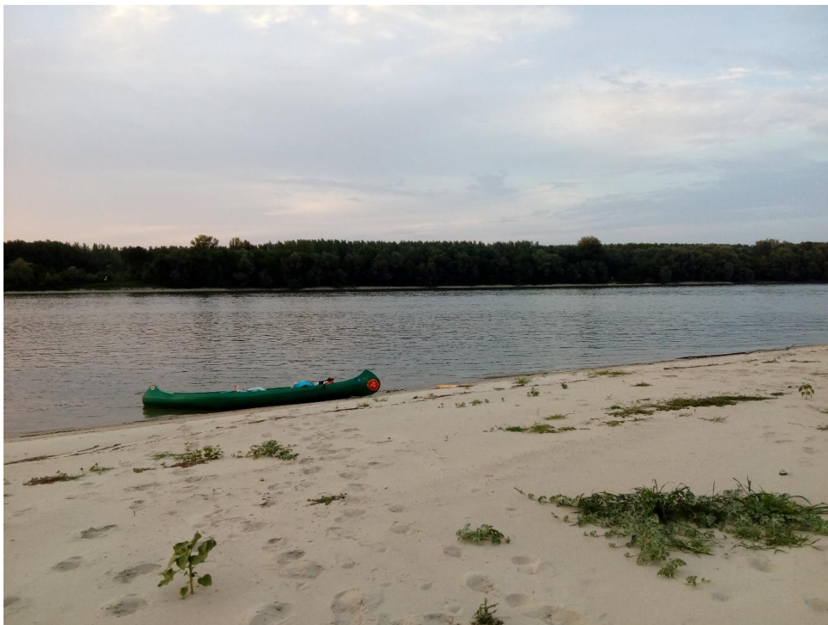
43. Kép: Utolsó tábohelyünk Baja alatt....