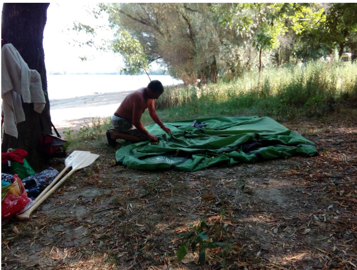
32. Kép: Sátorbontás Hartán