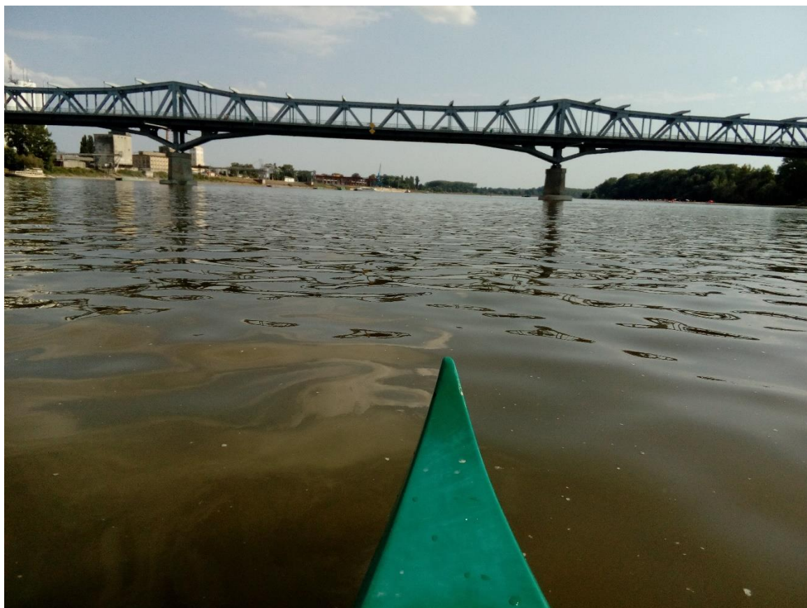
40. Kép: Bajához közeledünk

Vegyes érzelmekkel indulunk útnak, és ráadásul a böglyök is megvártak a kenuban. Ki is kötünk még Baja előtt egy fürdőhelyen, hátha megszabadulunk útitársainktól, de sajna ez