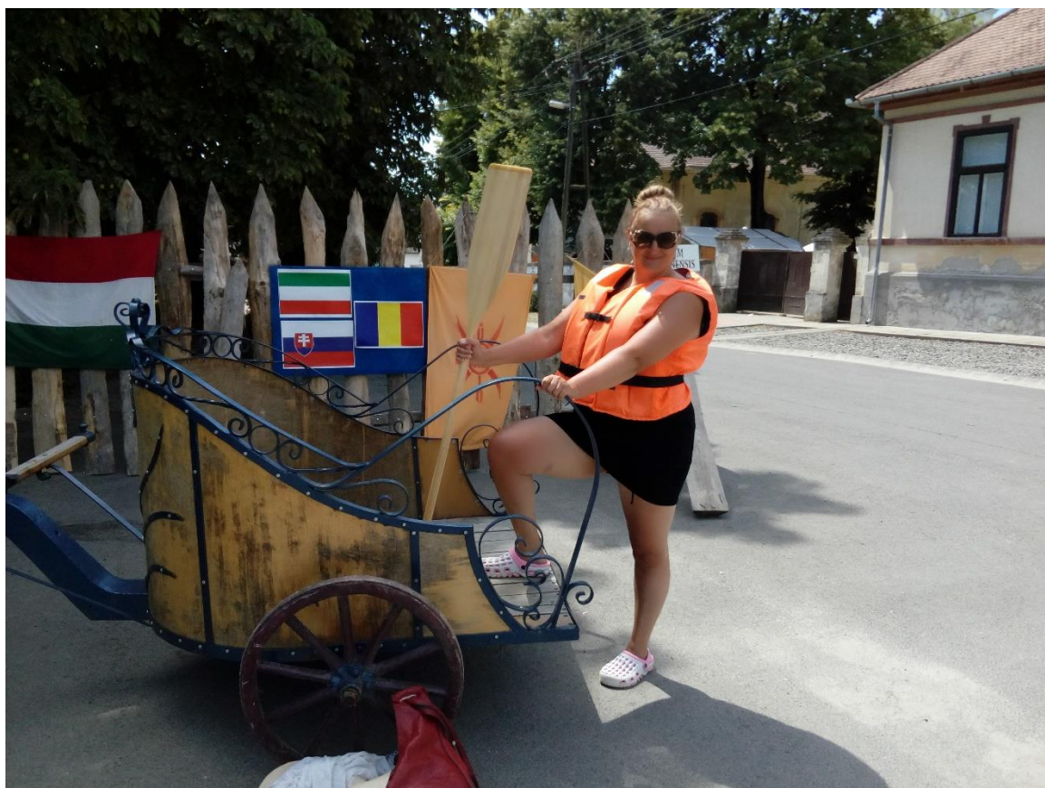
46. Kép: Dunaszekcsőn