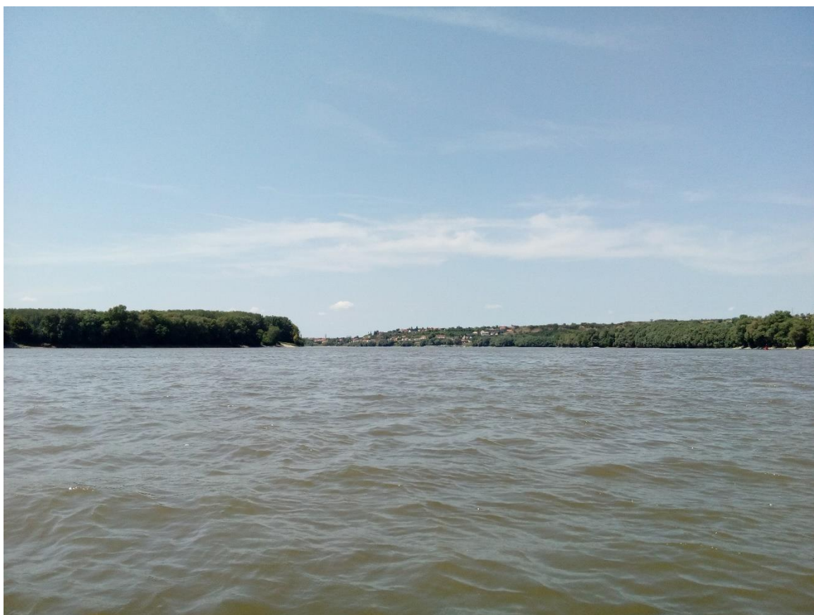
33. Kép: Szembeszélben közeledünk Pakshoz

járunk. Aztán nagy nehezen elindulunk. Az első 15 km Paksig, ott folytatódik, ahol tegnap abbahagytuk. A szél Nyugat-Dél Nyugati irányba fordul így oldal-szembe szél kapunk, hisz ezen a szakaszon a Duna folyásának az iránya Délnyugati. Paks előtt már teljes szembe szélben haladunk újra. Az oldal-szembe szél végig tekerte a hajót, most pedig a szembe szél akarja kicsavarni kezünkben a lapátot, néha frissítő zuhanyt permetezve arcunkba.