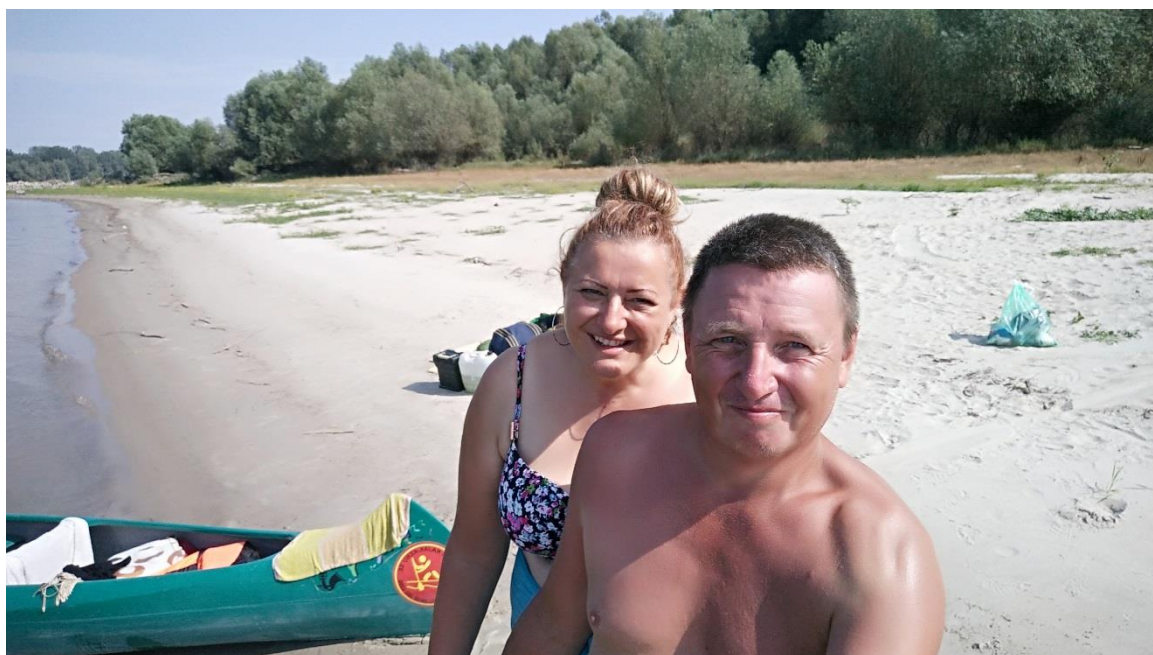
45. Kép: Az utolsó etap előtt

Reggel 6-kor kelek, mert a felkelő nap déli meleggel tölti meg a sátrunkat. Ez az utolsó napunk, innen már csak leérünk Mohácsig – gondolom ekkor. Ahogy számolom, 23-24 km kell még megtennünk addig, ahol randevút adtunk a gyerekeknek. A mellettünk lévő kőgát