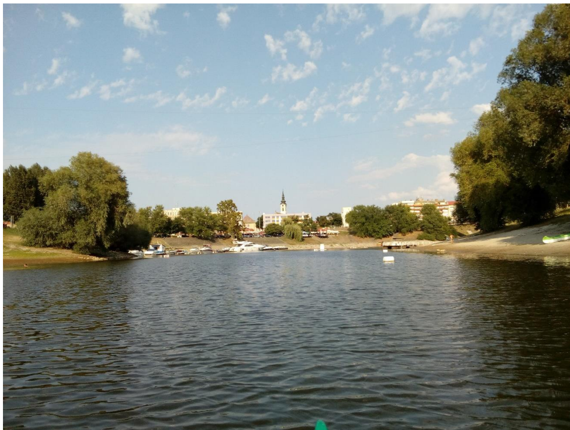
42. Kép: Baja belvárosa a Sugovicáról

negyed óra sétára található marketet, ahol pótoljuk kifogyó készleteinket. A kasszánál kosarunk tartalmát kifizetve, azonnal a hideg üdítőhöz nyúlunk és megkönnyebbülve frissítjük kiszárad torkunkat. Meleg van. Csillán kitörnek a fáradság fizikális jelei. Félttem Őt, de keményfából faragták és hamarosan újból a hajóban ül, és kifelé evezünk a mellékágból.