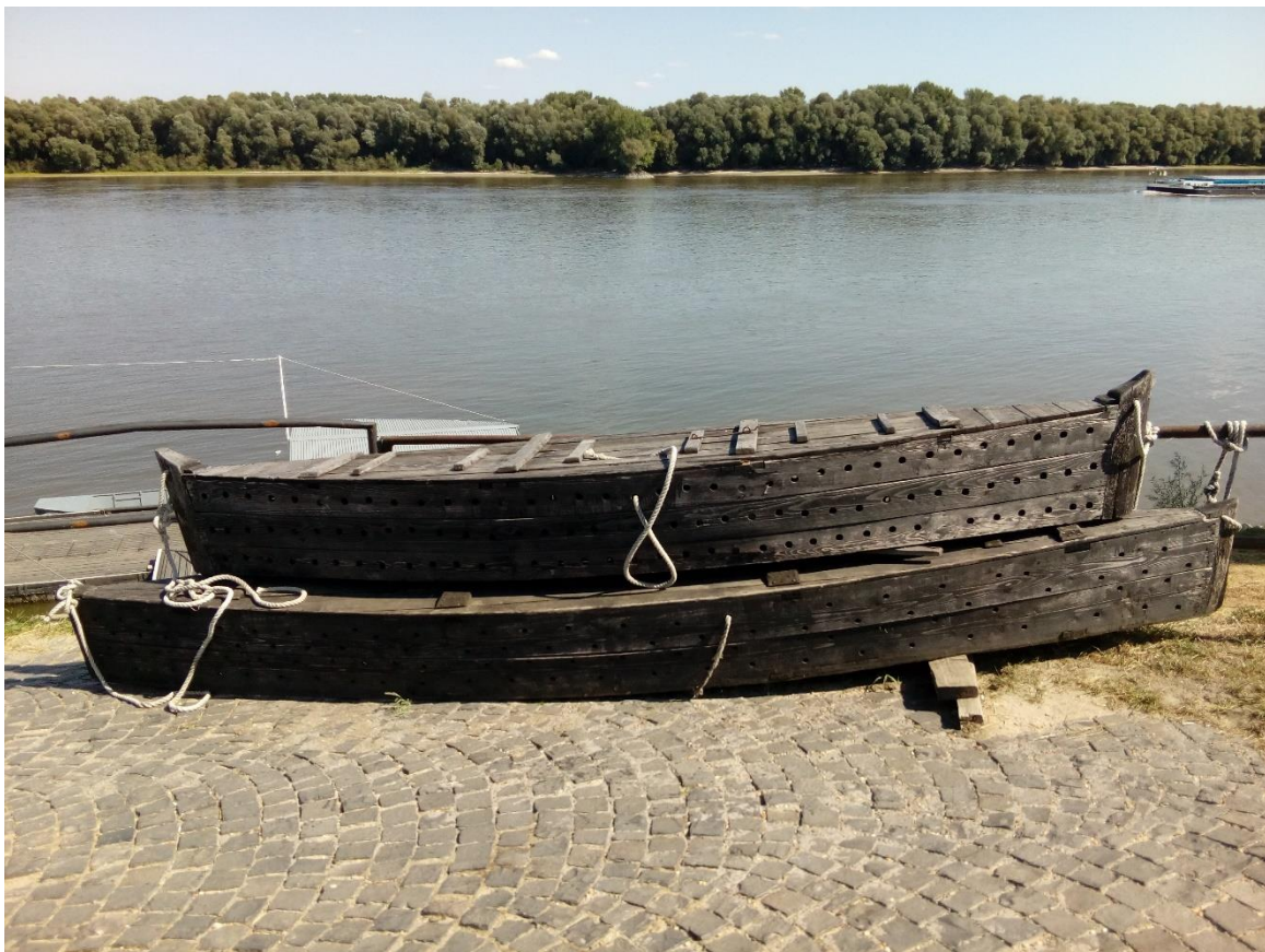
36. Kép: Hagyományos halászeszközök Paksra

Bár Paksra kikötni nem lehet, a vele szemben lévő gyönyörű partokon a városból kirajzott paksiak élvezik a napsütést. Az atomerőmű magasságában, gáttal elválasztva egy gőzölgő zuhatag ömlik a Dunába. Talán a reaktorok hűtővize? Később viszont egy masszív, hosszan