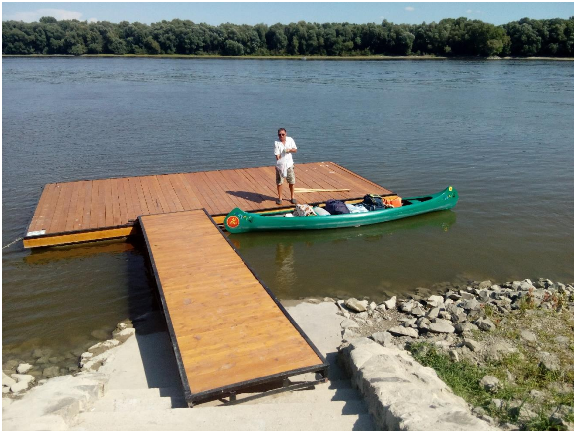
34. Kép: Happy-vel a paksi stégnél

alatt átkelve találunk egy másik éttermet. Kicsit gyanús, amikor helyet foglalunk, hogy rajtunk kívül nincs több vendég. De talán a tulaj lepődik meg a legjobban, hogy mit keresünk mi itt. Közli, hogy a melegre való tekintettel zárva van, és különben sincs ilyenkor vendég.