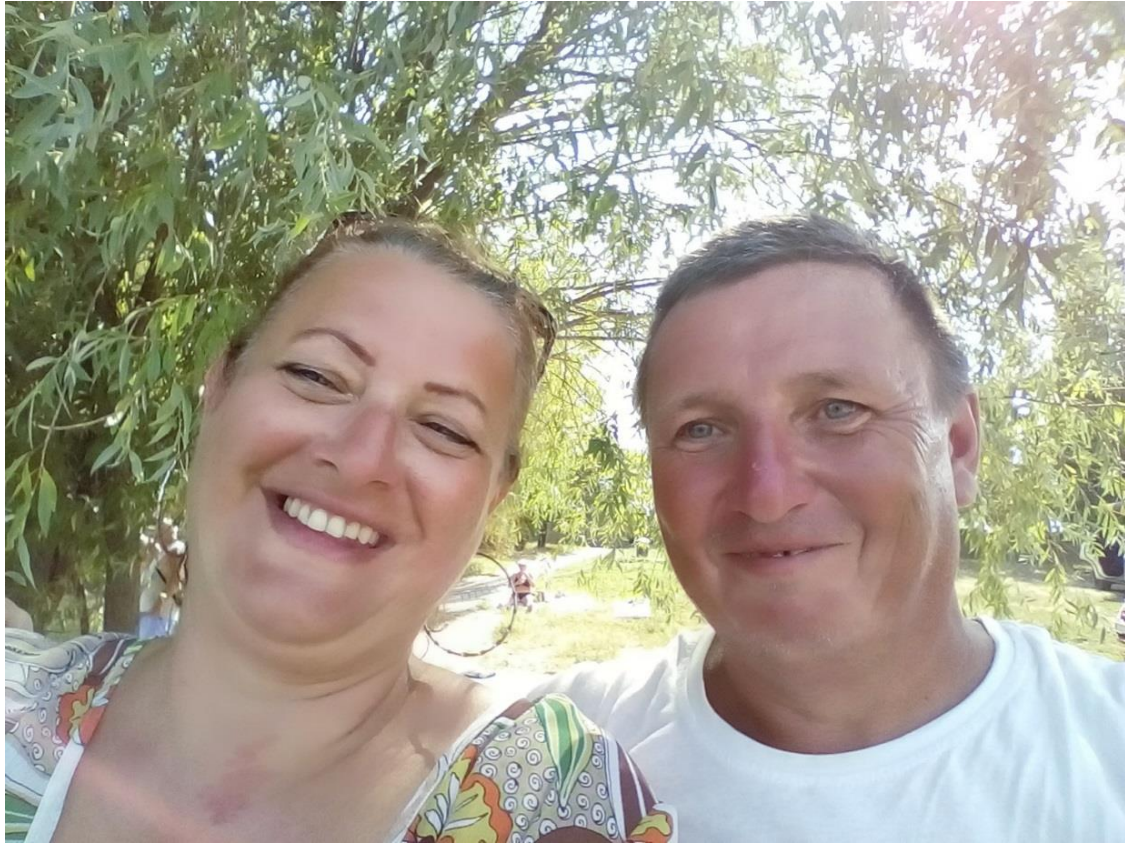
48. Kép: Végállomás - Ismét szárazföldön