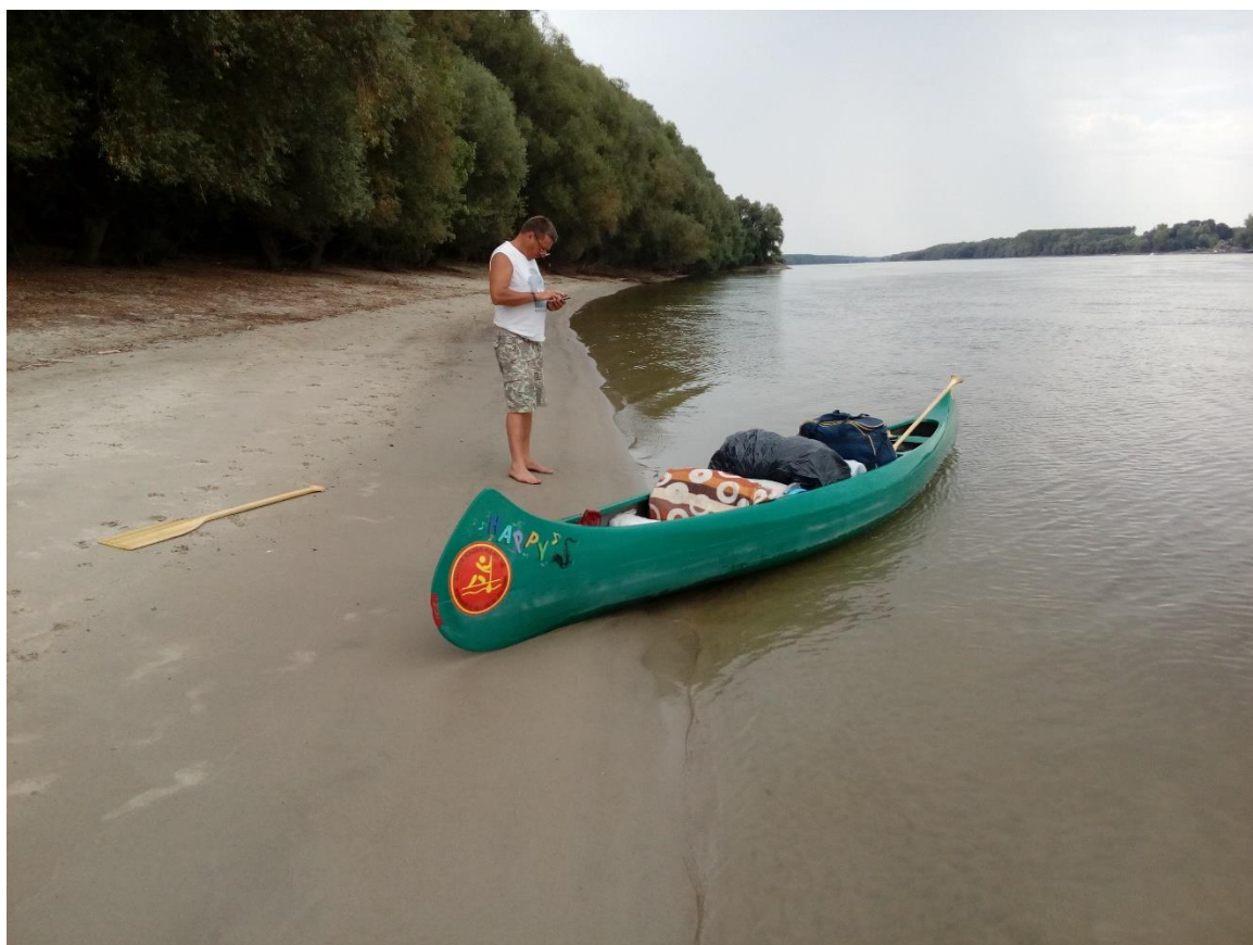
37. Kép: Radar elemzés a "dunai tengerparton"

evezni, és jóval kellemesebb helyen verhetünk volna tanyát. Pár perc múlva úgy látszik ez a cella is elkerül.