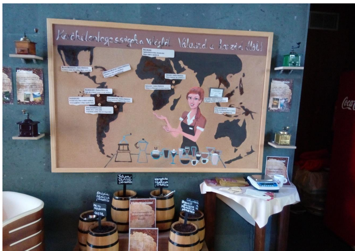
35. Kép: Kávékülönlegességek a világból

Szerelmemet egy igen jól kinéző jegeskávé és egy éppen elpusztított somlói desszert romjai mellett találok a klimatizált kávézóban. Kivirult orcáján látom, hogy máris jobb kedve van. Lelkesen meséli, hogy a világ különböző pontjáról szüretelt kávé közül lehet választani, amit természetesen frissen darálnak minden csésze kávé előtt. Meg is kóstolja