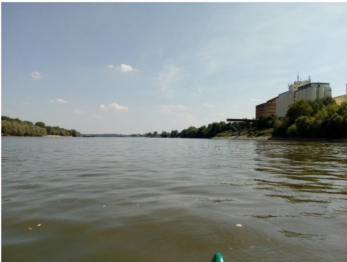
47. Kép: Előttünk Mohács

küzdjük magunkat utunk utolsó szakaszán. És a csodák most is megjelennek nekünk. Az utolsó 2 kilométeren, befordulva a Mohácsi kanyarba elcsendesedett a víz. A vámellenőrzésre váró hajók között siklunk be a „Sokacrév” kikötőbe, ahol minden februárban a Busók is megérkeznek hajójukon a túoldalról. Meglepetésünkre itt találkozunk néhány vízitúrázóval, akiknek szintén ez a végállomásuk. Vajon hol voltak az elmúlt 2 hétben?