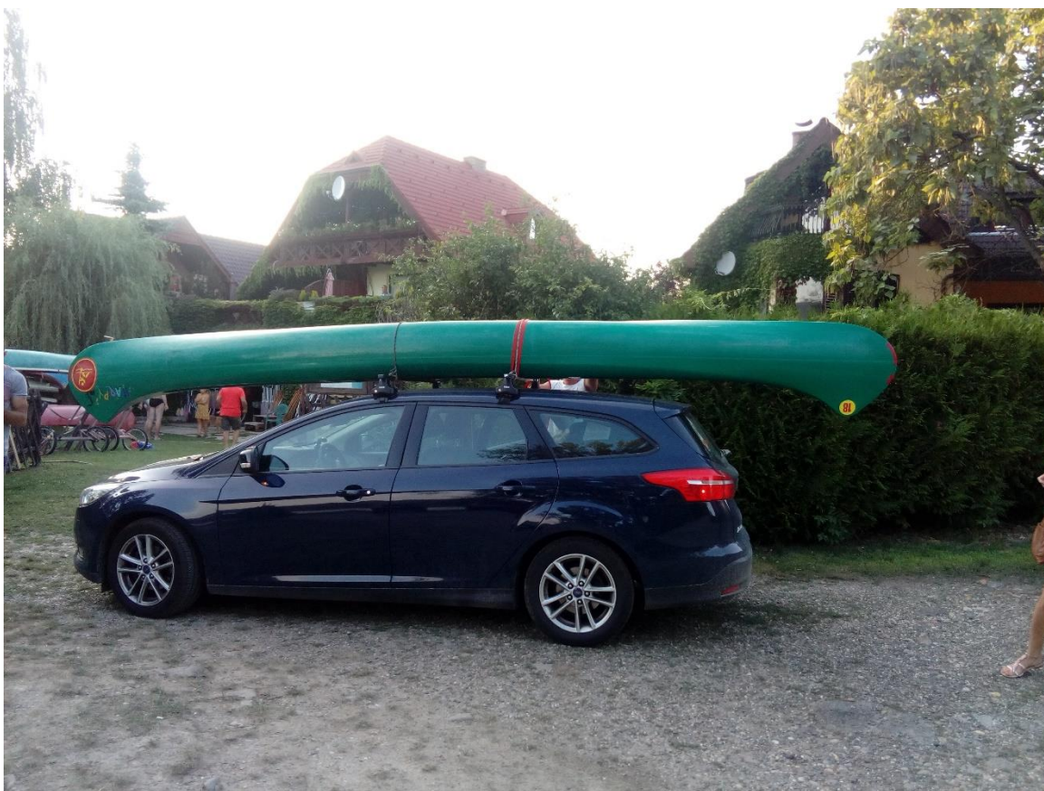
49. Kép: Happy is hazaérkezett

Elmúlik éjfél, mikor elcsendesedünk és a hálósák helyett újból a puha takaró alá bújunk. Másnapra szabadságot vettem ki, amire most nagyobb szükségem van, mint gondoltam.