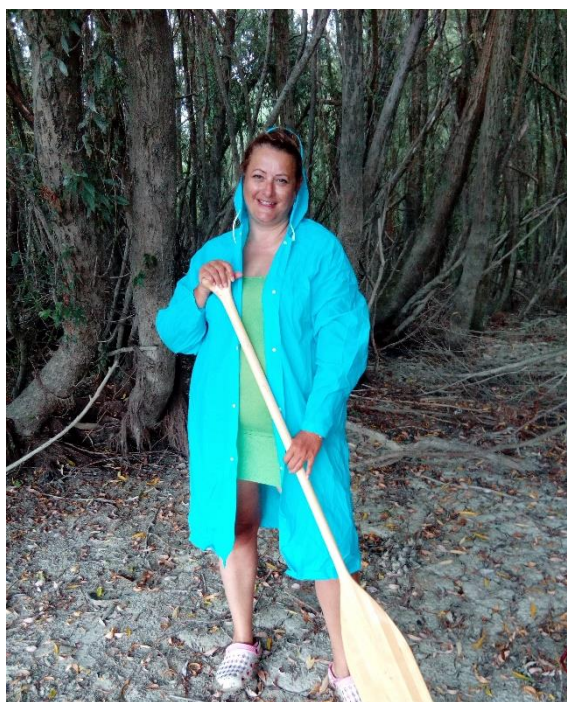
38. Kép: Esőben is boldogan

Kis fotózkodás a dunai tengerparton, majd újra hajóban vagyunk. Alig hogy beérünk a sodorvonalba, nyakunkba kapjuk a távolodó vihar hátvédjét egy kiadós eső kíséretében. Mivel vízhatlan ruháink rajtunk, a csomagok elővigyázatosan fóliával letakarva, így nincs nagy pánik. Azért újra kikötünk, és a parti fűzek oltalma alatt várjuk meg a zápor végét, ami nem tart túl sokáig. Kedvünk jó, erről tanúskodnak az esőkabátban készült képeink is. Negyed óra múlva ismét hajóban vagyunk. Ahogy a napocska előbújik a viharfelhők mögül mi is