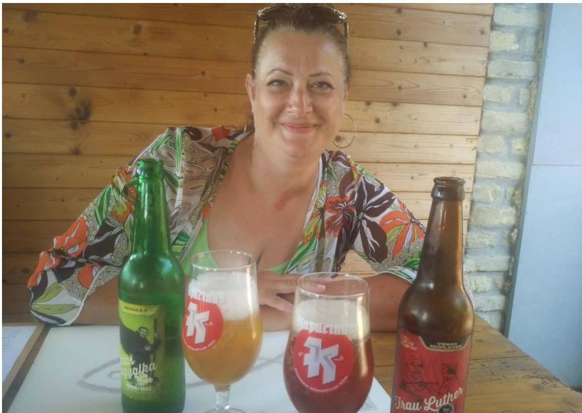
39. Kép: Így már kellemesebb az élet...

A Veronka szigettel szemben kötünk ki újból, pár száz méterrel a csárdától feljebb. Az étterem már az első benyomásra is jóval kecsegtetett. Nem egy hatalmas paprikafűzéses csárdát kell elképzelni, hanem egy hangulatos családi éttermet, egy kis védett