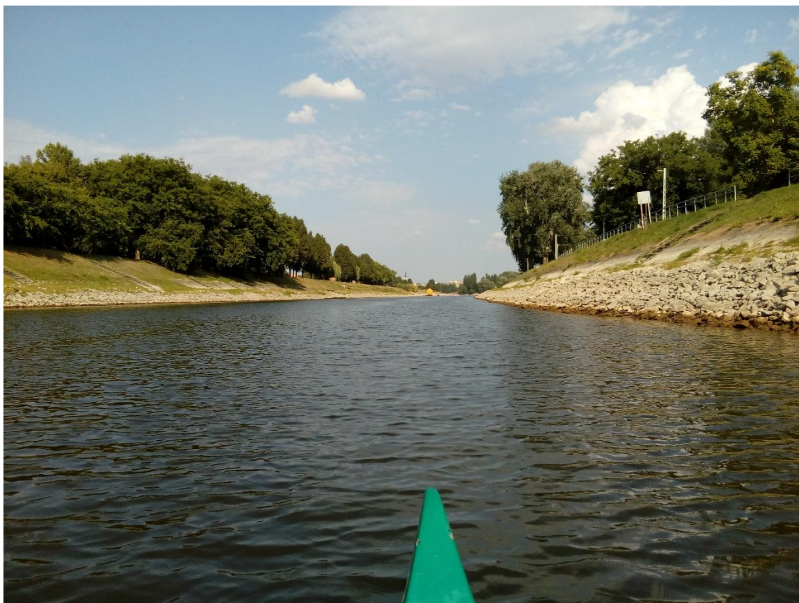
41. Kép: A Sugó

A Sugovica – más névén Kamarás Duna – a Duna egyik mellékága. Partján található Baja központja. Van egy feltevés miszerint a „Sugó” régen a Duna főága lehetett. A Szeremlei holt Dunát egy töltéssel zárták el, így csak úgy lehet visszatérni a fő mederbe, ha visszaevezünk a torkolathoz. A legenda szerint egy gazdag vízimolnár Súgó Vica nevű lányáról kapta a nevét, aki – miután apja visszautasította kedvese, egy szegény molnárlegény lánykérését – szerelmével együtt a folyóba ölte magát.