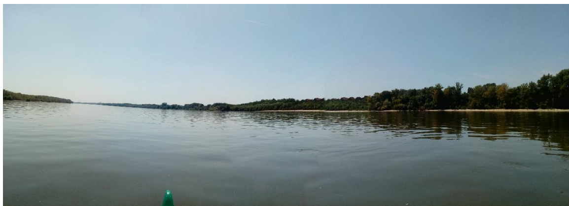
29. Kép: A Kisapostagi Duna

Kisapostagról illik néhány szót ejteni. Túránk után 1 hónappal, kocsival jártunk erre, a vízről látott part felfedezése okán. Mindketten meglepődtünk a takaros kis szlovák múltú falucska rendezettségén. Igazi ékszerdoboz, amire azt mondja az ember, hogy „jó itt lakni”. Bár már a bronzkorban is éltek erre emberek, igazán, mint Baraccsal összenőtt üdülő telepként lehetne jellemezni. Fellendülése a Dunai Vasmű megépülésével kezdődött, a munkalehetőség reményében ideköltözők mégsem borították fel a település báját, nem terhelték a szocreál építészet borzalmaival.