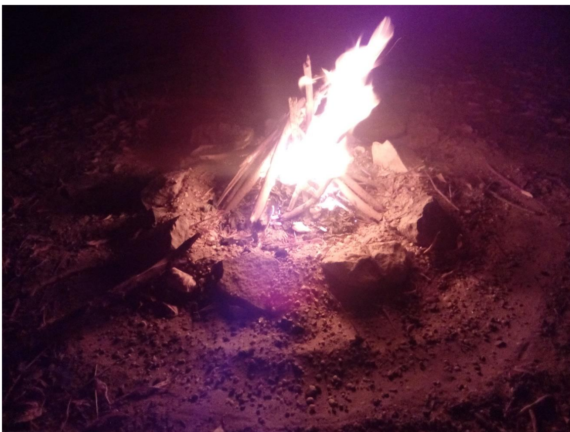
31. Kép:Hartai tábortűzünk

Éjszaka arra ébredünk, hogy szél lebegteti a sátrat. Nem túl nagy, de mindkettőnkben felmerül, hogy mi lesz, ha megerősödik. Így hát kikászálódunk a sátorból. A fényszennyeződéstől mentes éjszakai égbolton millió számra világítanak a csillagok. A tejút jól kivehető. Ez azt is jelenti, hogy felhőt nem hozott az Észak-Nyugati szél. Miközben gyönyörködünk, biztonságos helyre visszük a hajót és kötéllel ki is rögzítem. Ezt a rituálét 5 éve mindig elvégzem, mert abban az évben 2x el is felkapta a Kacsaszigetről a hajót. Mindkettő eset szerencsésen végződött, de az elsőnél stoppolnom kellett a szigetről, hogy átjussak a túlpartra, ahonnan nemsokára vissza is úszhattam, mert kb egy kilométerrel lejjebb, szemközt a bokorban pillantottam meg a kenut, ahol fent akadt egy vízre lógó faágban. Széltől borzolt vízben hajtottam végre a manővert, evezőlapáttal a kezemben. A második esetben fiatalok ébresztettek. Akkor csak 2 táborhellyel sodorta lejjebb a kavargó a szél a kicsit nehezebb kenut. Na, azóta van mindig nálunk kötél.