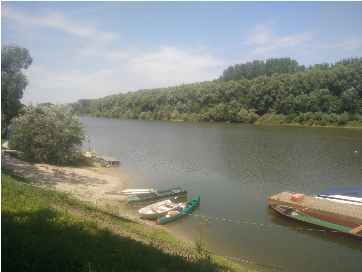
27. Kép: Happy az adonyi holtágban ringatózik

Pont délben érünk vissza a vízpart. A felerősödő déli szélben egyikünknek sincs túl nagy kedve