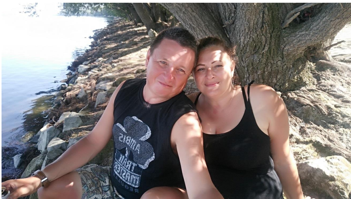
26. Kép: Reggeli után, indulás előtt...