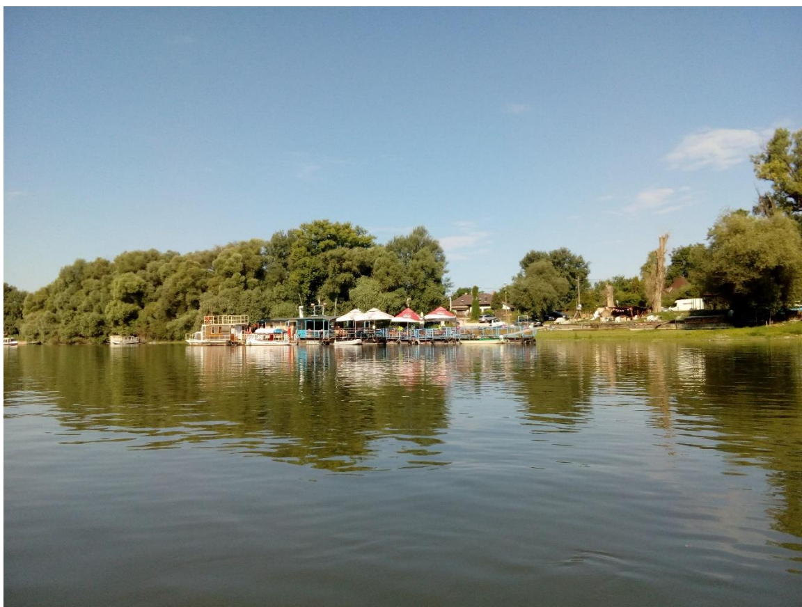
21. Kép: "Ebihal" a lupai ágban

Az Északi-Vasúti-híd előtt kötünk ki a Római Parton, ahol a legtöbb vendéglátóhely található. Az „Evezős” büfé (kiderül régi ismerőseim már eladták a helyet és a gyerekek, akik amúgy végig ott gürcöltek a szülőkkel nem vitték tovább a vállalkozást. – Hány ilyen látunk mostanság) előtti partszakaszt gondolom a buli paradicsom középpontjának, ezért itt húzzuk partra a Happyt.