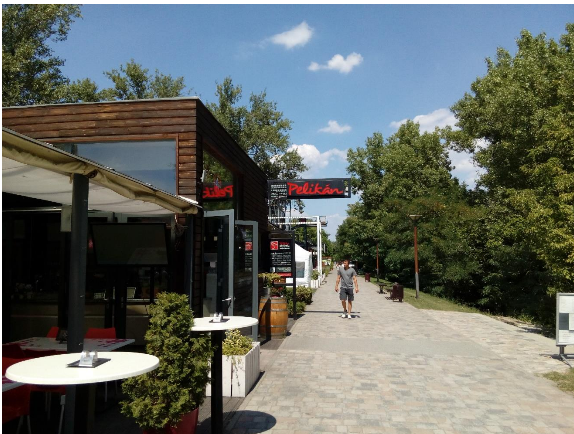
24. Kép: Pelikán Gátőrház Büfé - Kopaszi Gát