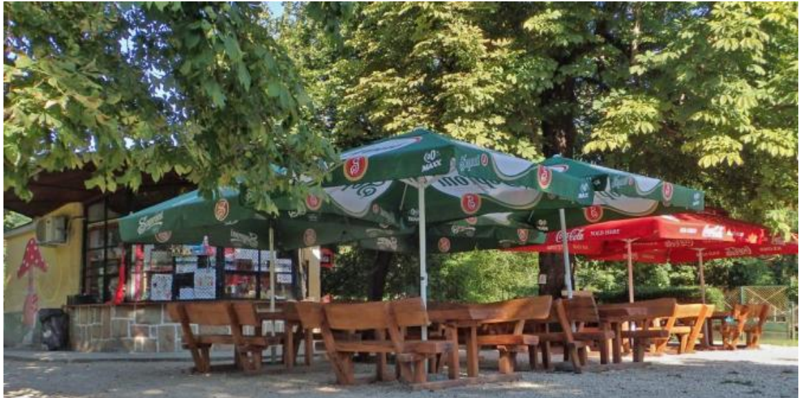
17. Kép: A kultikus Gomba

Visszatérve a táborunkba a pihenés a főszerep. Rá akarunk készülni az esti bulira. Végül is ezért húztuk annyira tegnap, hogy ezen a napon itt lehessünk. A pihenéshez az is hozzátartozik, hogy bekészítem a tábortüzet, ami fagyújtásból és a gúla megrakásából áll.