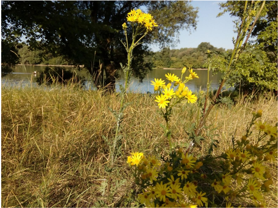
20. Kép: A reggeli Duna táborhelyünkről

Ma reggel az átlagnál is gyorsabban rendezzük össze magunkat. \frac{1}{2} 9-kor már indulunk is a megpakolt hajóval. Ez eddig még nem sikerült. Elsiklunk a Lupasziget nyugati ágán, míg a másiktól, a megyeri híd előtt edzésen lévő kajakos fiatalok bukkannak elő.