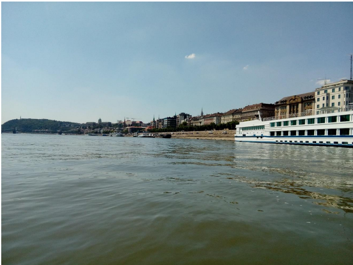
23. Kép: Áthaladás Budapesten - egy csendesebb szakasz

A Batthyány tér előtt elhaladva már áll az ideiglenes medence és a csupasz torony, ahonnan a sziklaugrók fogják pár nap múlva a mélybe vetni magukat. Az állványzatra már csak színes vászon fog kerülni, ami elfedi az alumínium csöveket. Ha pár nappal később lennénk, most a TV is közvetítené, ahogy felpakolva elhaladunk a verseny helyszíne alatt, háttérben a parlamenttel. 😊