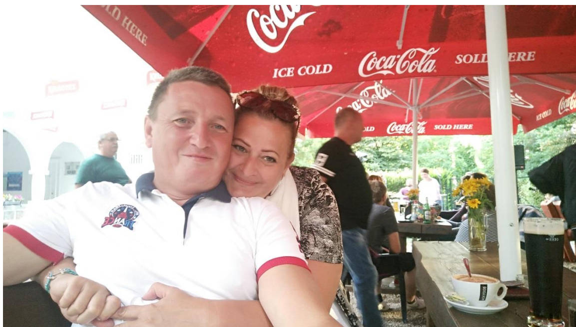
19. Kép: Buli a Gombában

megrémisztenek. Mert, ha még telefonálnának. De nem. A kommunikáció elsődleges forrásává vált a személytelen folyamatos pötyögtetés, amiből kialakul a modernkori kábítószer, mely nagyobb függőséget okoz bármilyen káros szenvedélynél.